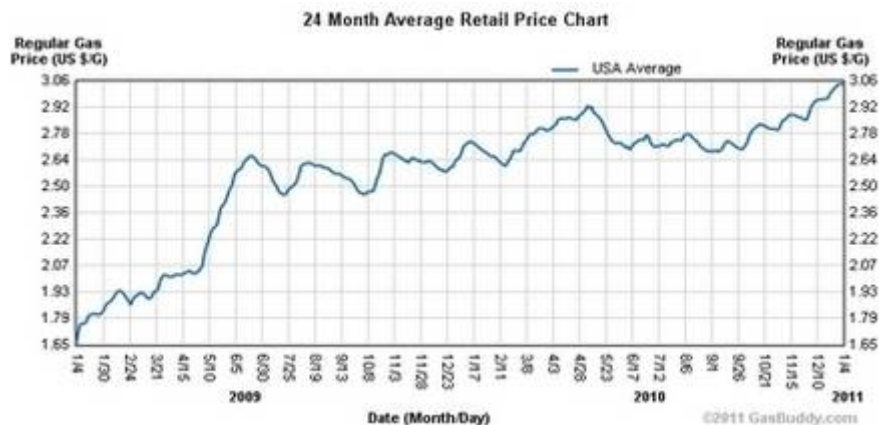
Entwicklung des Benzinpreises in den USA (2009 – 2011) - Quelle: GasBuddy, 01/2011

dadurch verschärft, dass in vielen Staaten der Ausbruch sozialer Unruhen und schwerer wirtschaftlicher Krisen drohen.